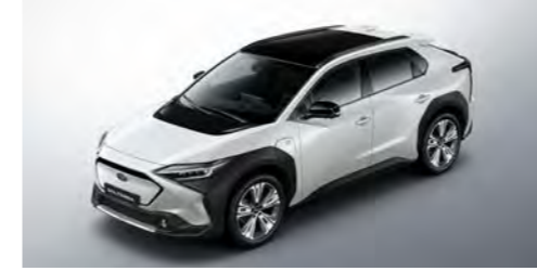
Platinum White Pearl Mica