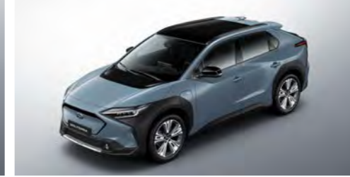
Harbor Mist Grey Pearl