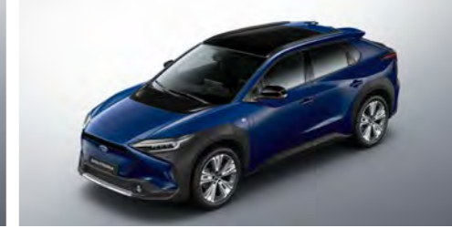
Dark Blue Mica