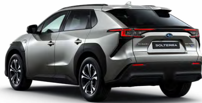
Limited, Precious Metal