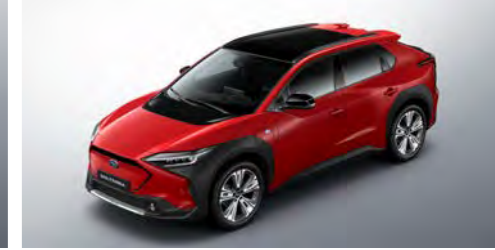
Emotional Red 2