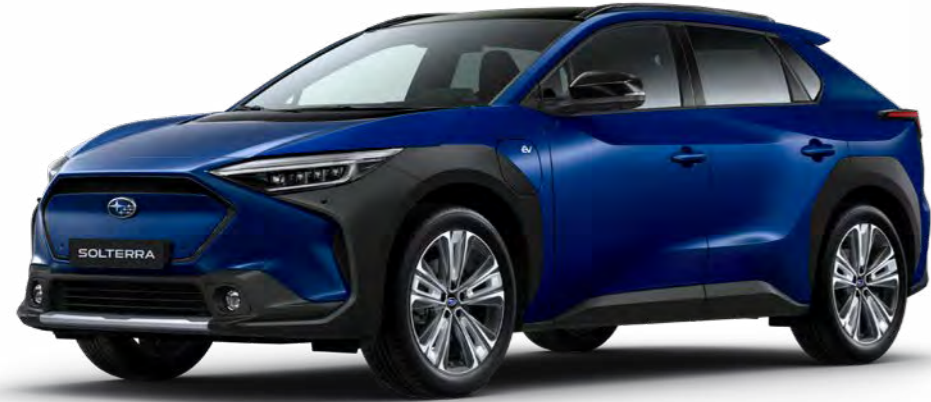
Touring /Touring + , Dark Blue Mica