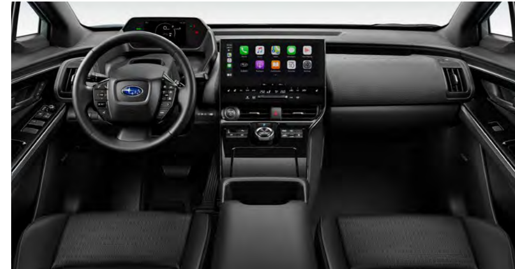
Touring / Touring +