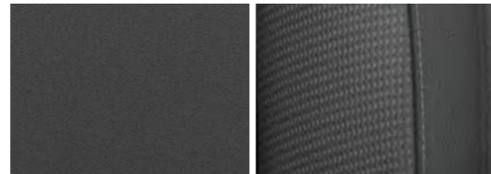
Musta kangas (Limited)