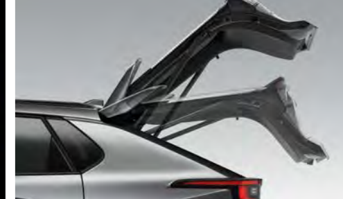
Sähkötoiminen takaluukun avaus