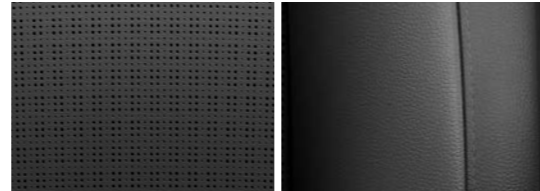
Musta keino nahka (Touring / Touring +)