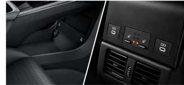
USB C -portit (edessä ja takana)